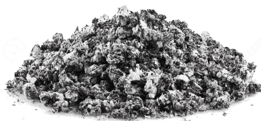
2 verres de cendre tamisée